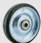
ゴム (鋼板ホイール,B入) (WF)