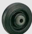
ゴム (ナイロンホイール,B入) (NR)