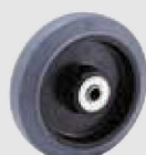
グレーゴム (ナイロンホイール,B入) (NR-G)