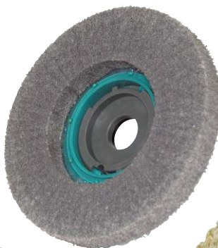
SG 鏡面一発ディスク #400