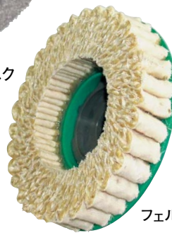
SG サイザルディスク