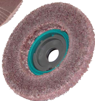
SG 鏡面一発ディスク #240