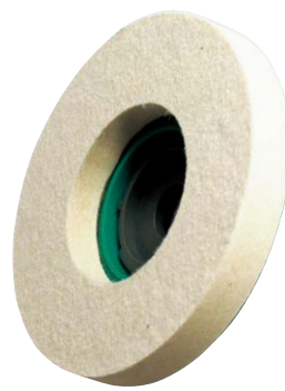
SG フェルトディスクソフト