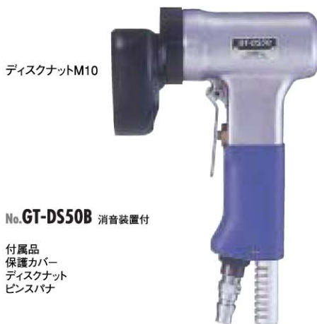
No. GT-DS50B 消音装置付