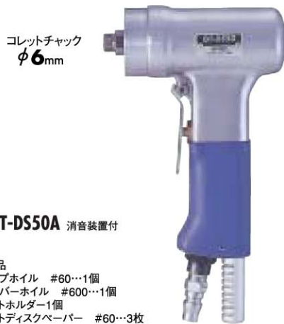
No. GT-DS50A 消音装置付

付属品 フラップホイール #60...1個 ファイバーホイール #600...1個 ピタットホルダー1個 ピタットディスクペーパー #60...3枚