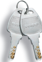
กุญแจต่างกัน Key differences