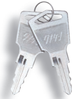
กุญแจ No.T0230 Key