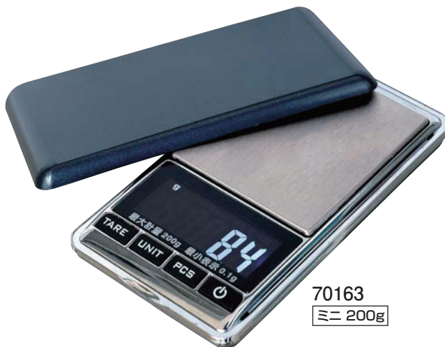
70163 ミニ 200g