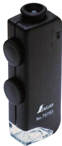
75753 H 60倍~100倍 LEDライト付