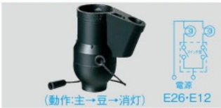
Ⓜ WW1220B 希望小売価格 750円(税抜) スタンド用親子プルソケット(黒)3A 250V

●白熱電球60W以下、電球形蛍光灯22W以下、LED電球11W以下でご使用ください。(2016年3月時点 パナソニック製電球での確認による。)