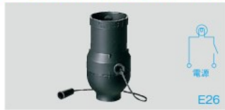
Ⓜ WW1200B 希望小売価格 550円(税抜) スタンド用プルソケット(黒)3A 250V