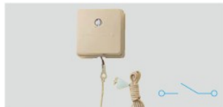
Ⓜ WS3202K 希望小売価格 480円(税抜) 10A角形プルスイッチ(ラクダ) 10A 250V