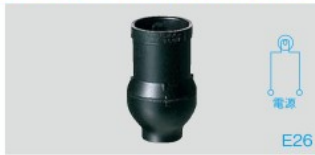
Ⓜ WW1420B 希望小売価格 390円(税抜) スタンド用パイプキーレスソケット(黒)6A 250V