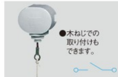
Ⓜ WS5201H 希望小売価格 360円(税抜) キャノピスイッチ 3A 300V