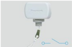
Ⓜ WS5201H 希望小売価格 360円(税抜) 小型キャノピスイッチ(グレー)3A 300V