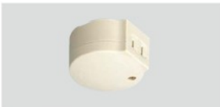
Ⓜ WK1102 希望小売価格 440円(税抜) コンセント2型(ラクダ) (スイッチ回路付)15A 125V