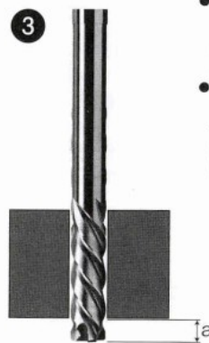
第三段階 Third Step

●仕上刃により、安定した取り代を仕上げ加工 After first step, it can process the final finish reaming by secondary teeth.