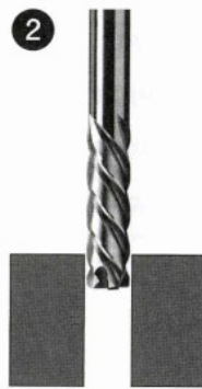
第二段階 Second Step

●粗刃でバラツキのある下穴を粗仕上加工 In case of varying pre-hole diameter, it can process the semi-finish reaming by first teeth.