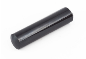
溝付きピン A形 DIN 1471

欧米では一般的な、相手穴精度を必要としない簡易型ノックピンです。 溝両側に形成された突起により、締結します。多くの形状があり、用途によって最適なものが選択できます。 相手穴推奨公差は、呼び径3mmまではH9、呼び径4mm以上はH11です。