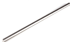
ロングピン h7 S45C 材質 S45C相当(未熱処理)