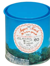
内装 (外径100mm 20枚入り)