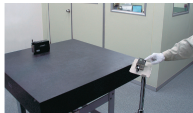
DL-S2W との組み合わせ例