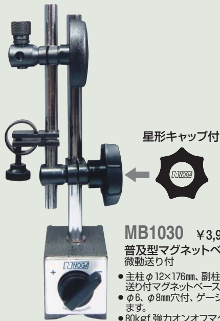
MB1030 ¥3,900 普及型マグネットベース 微動送り付