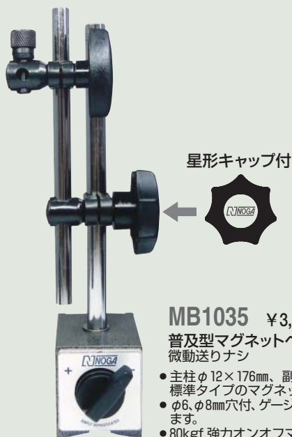
MB1035 ¥3,500 普及型マグネットベース 微動送りなし