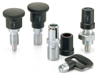
PDX インデックスプランジャ (P.444~P.445)