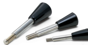
LCGS コニカルグリップレバー (P.107)