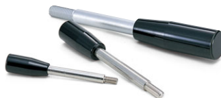
[LRG] プラスチックグリップレバー (P.106)