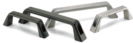
UIC キャビネット取手 (P.220)