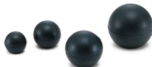
KGB ゴムボール (P.193)