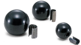
KSP セルフロックプラスチックボール (P.192)