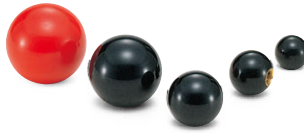
PB PC プラスチックボール (P.191)