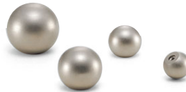
KSB ステンレスボール (P.195)