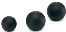
KBA KBC プラスチックボール (P.190)