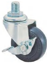
SR-50 RM S-1