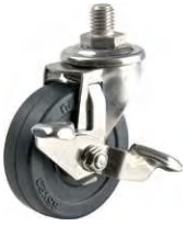
SU-SEL-65 RL S-2

▶▶ SU-SEL / SU-SM 自在 S-2ストッパー 65-100mm / S-2ストッパーは車輪の回転を止めるストッパーです。