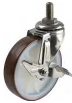
SU-SM-100 UM S-2