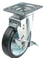
STM-150 VS S-2

▶▶ STM 自在 S-2・S-3ストッパー 75-200mm / S-2、S-3ストッパーは車輪の回転を止めるストッパーです。