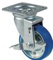
STM-100 VU S-3