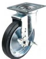
STM-200 VS S-2