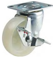
TCM-75 NM S-1