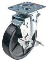
STC-150 CBC SW-4

▶▶ STC 自在 SW-4 ストッパー 125-150mm / SW-4ストッパーは、S-4ストッパーに車輪の回転を止める機能をつけたストッパーです。