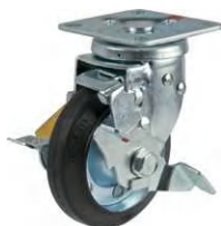
STC-125 CBC SW-15

▶▶ STC 自在 SW-15 ストッパー 125mm / SW-15ストッパーは、S-15ストッパーに車輪の回転を止める機能をつけたストッパーです。