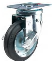
STC-125 CBC S-15