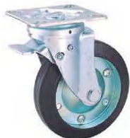
STC-150 CBC S-4