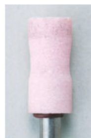
一般的な砥石 (PA) Mounted Point (PA)