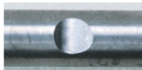
超硬材 / Carbide material