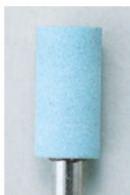
スーパーダイヤモンド砥石 Super Diamond Mounted Point