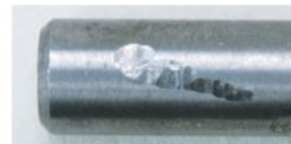
超硬材 / Carbide material