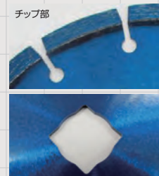
SL25522の穴径は20角穴と兼用です。

各被削材に対応する商品選定については122ページの被削材対応表をご参照ください。