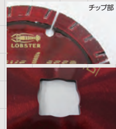
WL25522の穴径は20角穴と兼用です。