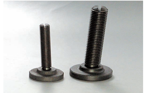
TP-2 + GS