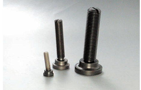
TP-1 + GS