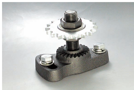
FLS + ID + SPB