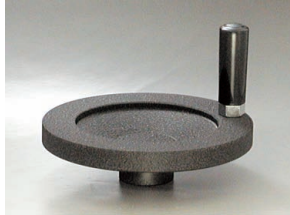
AH-N + ER