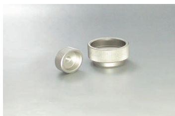
KNTA-sus 材 ステンレスSUS303 Stainless

Knurled Nuts KNTA-sus Knurled Nuts KNTA-B, KNTB-B Knurled Nuts KNTA, KNTB