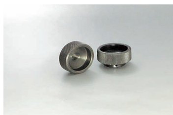
KNTA-B 材 鋼材S45C Steel KNTB-B 表 黒色四三酸化鉄皮膜 Black oxide finish