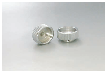
KNTA 材 鋼材S45C Steel KNTB 表 クロムメッキ Chrome plated