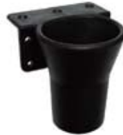
KH-1, 2, 3, 5, 6