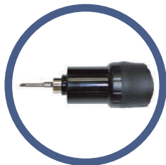
トルク固定リング標準添付

トルク設定された調整リングを外部からの衝撃などから守り、調整リングのズレを防ぎます。