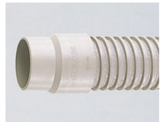
ダクトカフス付き