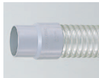
ダクトカフス付き