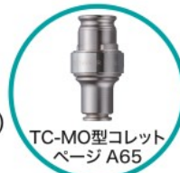
TC-MO型コレット ページ A65