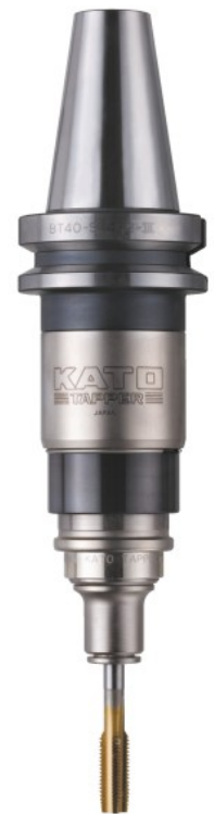
BT40-SA1022-III + TC1022-MO

※ F 1 : 縮み量 F 2 : 伸び量 F 4 : 逆転時の伸び量 ※ F 2 ・F 4 量は参考値です。