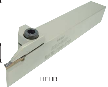
本図は右勝手を示す。