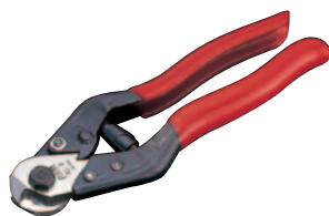
ワイヤロープカッター