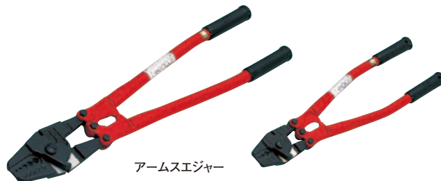
アームスエジャー