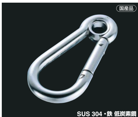
SUS 304・鉄 低炭素鋼