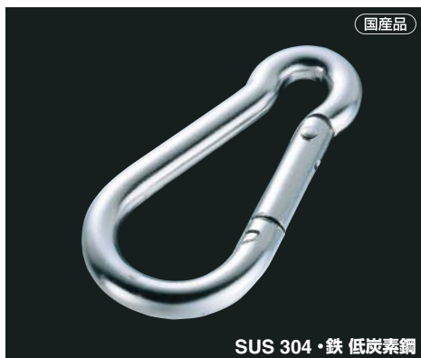
SUS 304・鉄 低炭素鋼