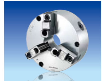
前面取付仕様 / 前面・背面取付兼用仕様