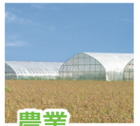
農業... ハウス・養鶏