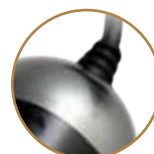
断線防止ケーブル