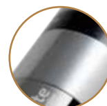
丈夫なメタルボディ

アルミ合金の精密ダイキャストボディを採用。非常に剛性が高く堅牢さもアップしました。精密さと高級感溢れるボディは、実用的なだけでなく使う喜びを感じさせてくれます。ケーブルの断線防止、ピント調節時の画像の動きの改良、静電気防止、などの特徴も備えます。